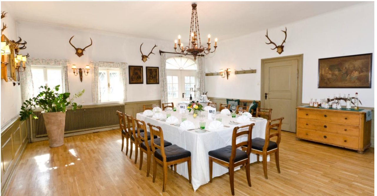
Jagdstube – bis 30 Personen