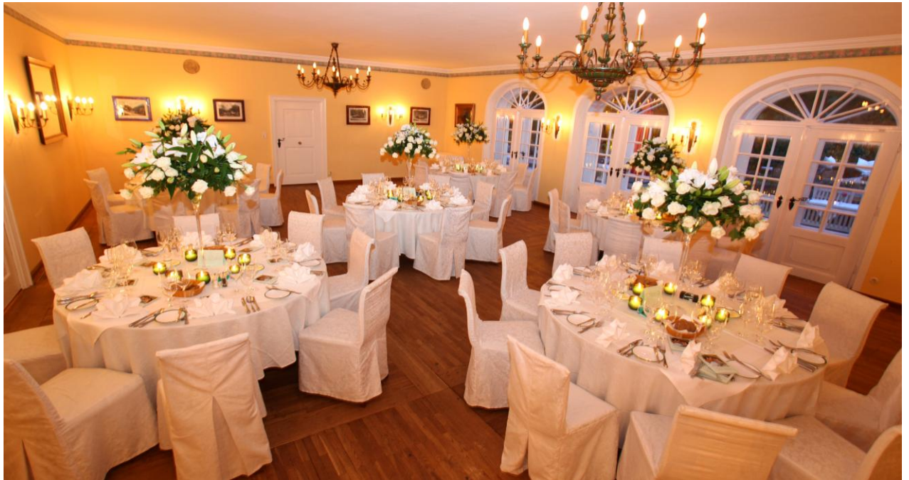
Biedermeiersaal – bis 80 Personen