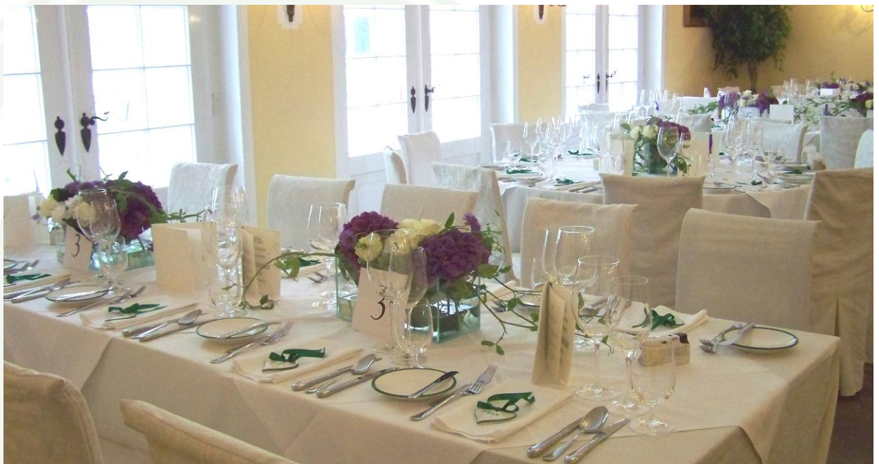
Biedermeiersaal – bis 80 Personen