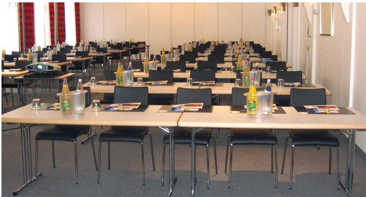
Bestuhlungsbeispiel Kino Mozart I-III

Kapazität für bis zu 280 Personen in Kinobestuhlung.