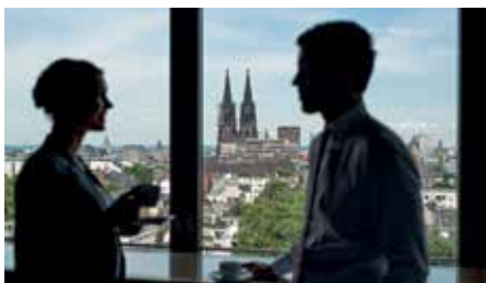
Mit Domblick: Meetingräume, Bar georgeM. im 12. Stock und 90 Zimmer

Das Hotel schafft mit seinem großzügigen und eleganten Flair einen stilvollen Raum für kreative Entfaltung und spannende Begegnungen. Wer erhabene Ausblicke sucht, wird in der Bar im 12. Stock fündig: Der Blick kann hier weit über die Dächer von Köln schweifen. Ein gläserner Außenaufzug setzt ein weiteres markantes optisches Erkennungszeichen. Es gibt eben viele Hingucker im Pullman Cologne.