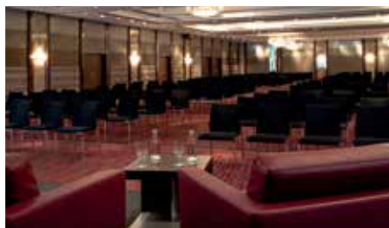
Zweitgrößter Ballsaal der Stadt Köln