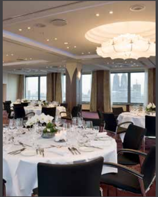
1. CATERING - 2. MEETINGRAUM DOM - 3. RESTAURANT GEORGEM. - 4. MEETINGRAUM BELVEDERE