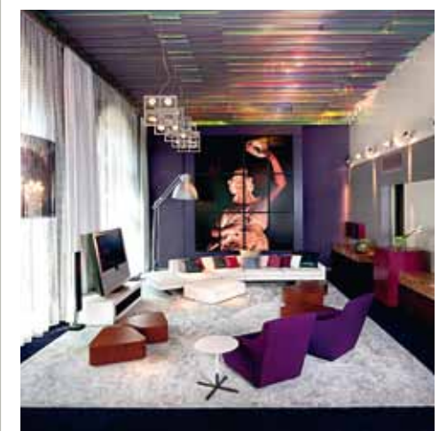
339 guestrooms and suites

InspiredMeetings™ are organized by experts who capture the essence of your project in order to make your event unique and personalized. An event where Life is Magnifique. Committed to building completely successful and tailored meetings and events, your dedicated InspiredMeetings™ team will suggest creative and custom-made banqueting options, customize the environment with modern and high tech equipment to fit your needs, recommend innovative activities to stimulate your participants and... much more.