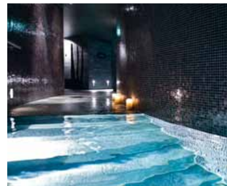
Spa with heated pool, steam bath and sauna

zeitgenössischer Hotelkultur kreiert. Das Hotel verfügt über 339 elegante Zimmer und 57 Suiten, die auf höchste Ansprüche zugeschnitten sind. Genießen Sie Komfort Highlights wie das exklusive Sofitel MyBed™-Konzept oder die in den Wohnbereich integrierten Naturstein-Wellness-Bäder. Die zweistöckigen Duplex Junior Suiten bieten einen wunderbaren Blick auf die Alpen oder über die Dächer Münchens. Von der Planung bis hin zur Durchführung Ihrer Veranstaltung unterstützen wir Sie gern bei allen Schritten mit unserem maßgeschneiderten Tagungsservice.