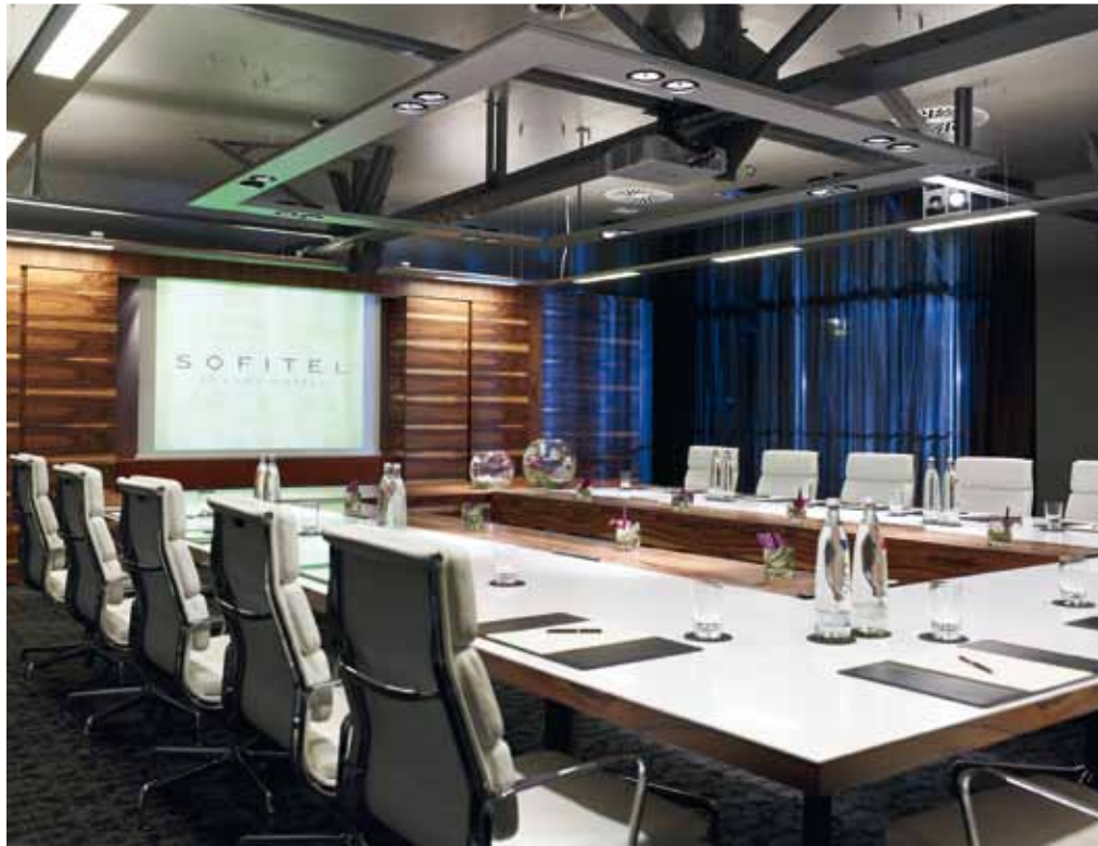
Maßgeschneiderter Tagungsservice von Sofitel InspiredMeetings™ Turn your meetings in Munich into InspiredMeetings™