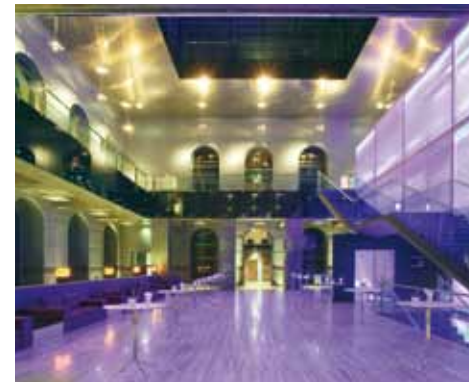
Sophisticated and spacious lobby and hallways