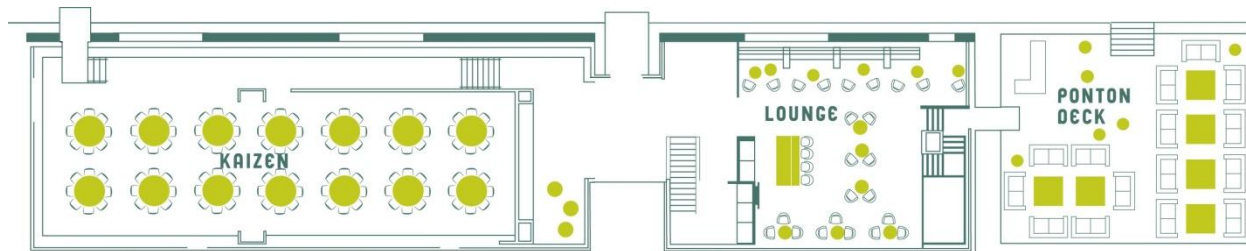
Bankett, in „KAIZEN“