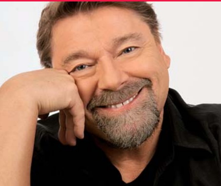
Jürgen von der Lippe, Comedian